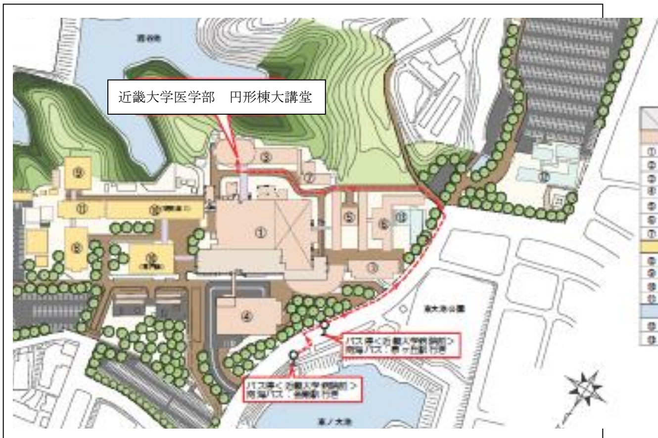
会場までの地図 バス停からの経路

自家用車でおいでの場合、かならず‘患者様用駐車場(駐車料金が必要となります)’をご利用下さい。