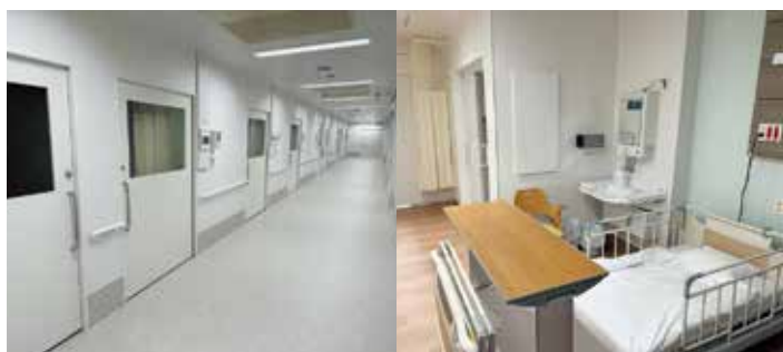
血液内科病棟（無菌室を43床完備）