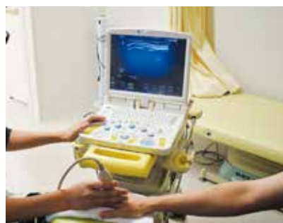
膠原病内科関節エコー