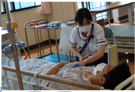
『今、技術の確認ができてよかった！』