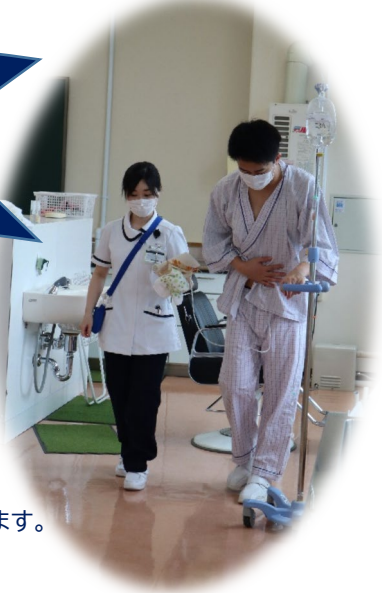
術後の歩行・・・ 患者役も考えます。

成人看護学実習の学内プログラムに取り組む3年生は、今日も元気です。 術前・術後の看護について、個人・グループで考えて、試行錯誤しながら技術練習に取り組みました。