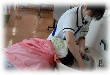
「シャンプーは上向きがいいかな？ 下向きがいいかな？」