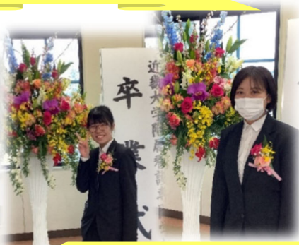
看護部会・同窓会「礎」から 花束も頂きました